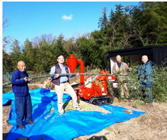
— シニア世代の新たなチャレンジ —