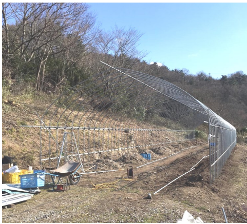
設置中のビニールハウス

十二月からビニールハウスの設置が進んでいます。これまでの農産物は全て路地栽培で収穫時期が決まっておりますが、フレッシュハーブを出荷するようになり、年間を通じて供給して欲しいとの声から、ビニールハウスの設置を決めました。