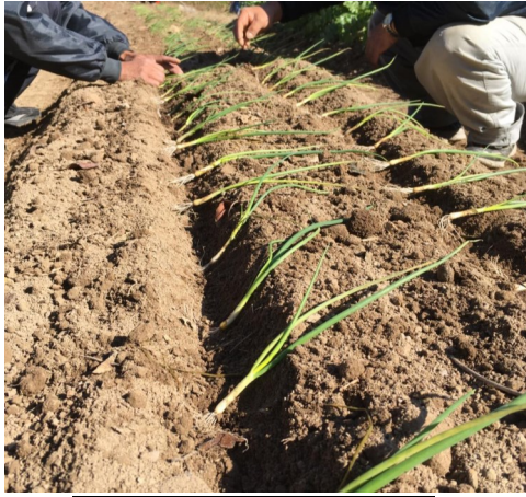
玉ねぎ苗の植え付け

十二月上旬、玉ねぎの植え付けを行いました。本来は十一月中に定植しなければならぬのですが、遅れての植え付けで、しっかり生育してくれるか心配しておりましたが、現在は元気に育っています。