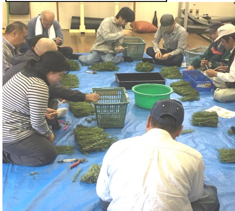
ローズマリーの選別風景

平成二十九年度の就労準備支援事業が終了致しました。今年も高松市と善通寺市から委託を受け、多くの方が参加してください、様々な活動を通じて健康を取り戻した方、生活リズムが整った方、就労された方がいらっしやいます。