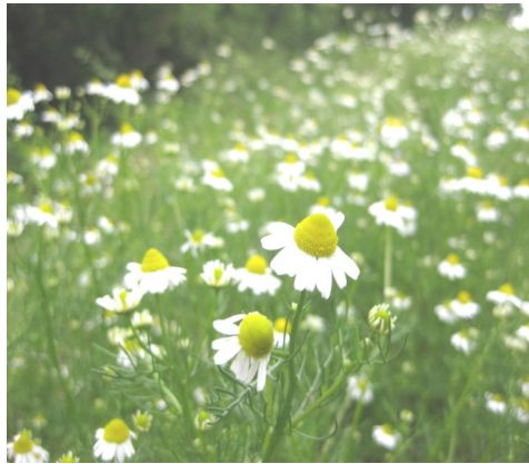
満開のカモミール

白く可愛らしい花はリンゴの香りがし、摘み取り作業は気持ちをはがらかにしてくれます。