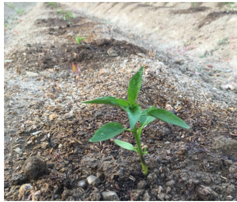
植え付けを終えた唐辛子

ビニールハウスの中で育てていた香川本鷹唐辛子の苗を、十七日に第一弾として約千苗を植え付けました。