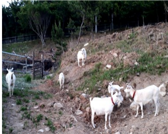
— 自給自足も禅寺の選択肢か —

大本山總持寺での五年間の修行を了えて自坊の喝破道場に帰山して約一〇年。 任に当たって他に譲り難し、の思いで修行でしたが得ることの多い五年間でもありました。が、反面喝破道場の立場からすると空白の五年間でもありました。 弟子たちが支えてくれていたもの、矢張り道場主不在による道場運営の衰退は目に見えるものがありました。