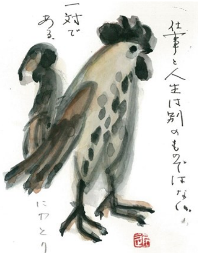
大阪市 山口 近香