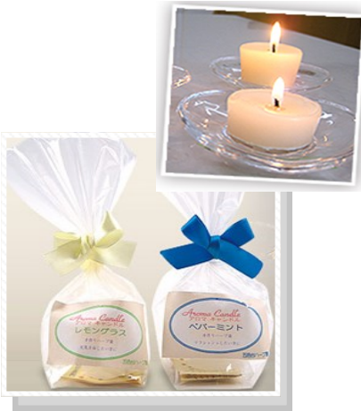
1袋 309円(内税) キャンドルのみの販売です。

E-mail: kappa@kappa.or.jp Tel: 087-882-4022