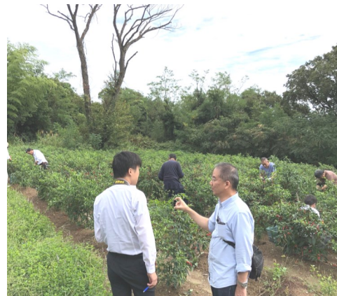
読売新聞から取材を受ける

してスーパーやインターネットで販売しています。B級品は業務用としてキロ単位で卸しています。C級品は粉末にして販売しています。二十七日は読売新聞から香川本鷹の取材を受けました。収穫から乾燥までの作業を取材してくれました。