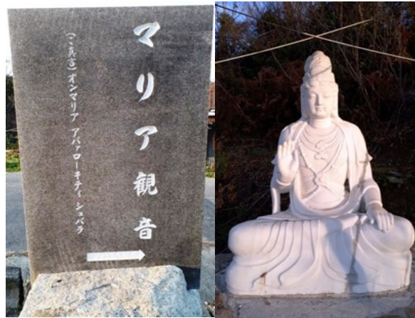
— ハーブ園に鎮座するマリア観音さま —