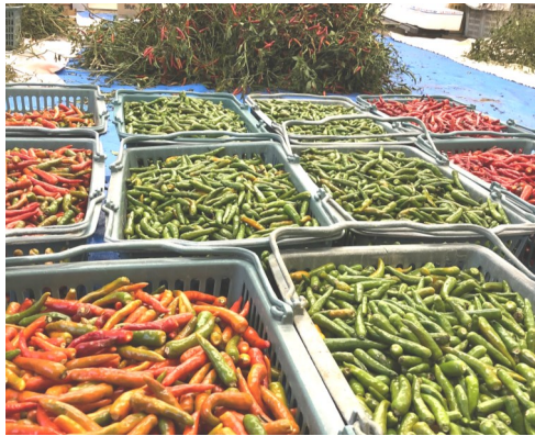
選別後の赤・青・黄唐辛子

しかし、より完熟状態となっている赤唐辛子の方が辛みが強いのです。青唐辛子は赤唐辛子よりもみずみずしく、辛みが抑えられているので、加熱調理ではなくピクルスや柚子胡椒といった生食がオススメです。十二月に入っても赤と青の唐辛子を収穫できますが、霜にあたると実が傷んで腐ってしまいます。その為、寒波がくる前に全て収穫しなくてはなりません。株元から切り取り室内で収穫と選別の作業が続きました。赤くも青くもない、色が変わる途中の唐辛子は黄唐辛子として選別します。