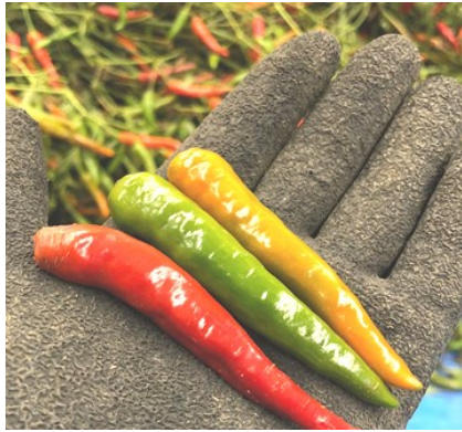
赤・青・黄の唐辛子

唐辛子は青唐辛子と赤唐辛子が存在しますが、実は同じ唐辛子なのです。収穫時期を変えることで青と赤の唐辛子が採れます。唐辛子の収穫は、花が咲いてから三週間後位から始まります。初めは青い唐辛子です。青唐辛子は未熟な唐辛子で、これを実らせたまま完熟させると赤色になります。