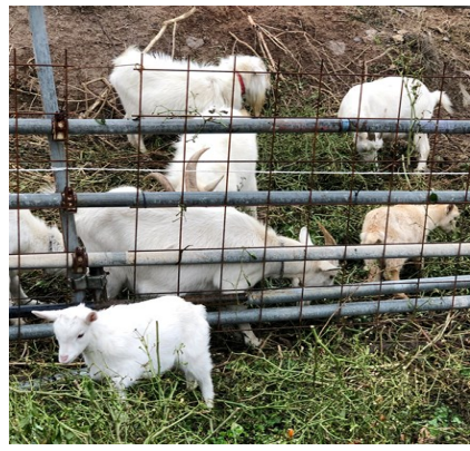
— すくすくと育つ2頭の子ヤギ —

4 元旦(三日) 恒例新年茶会 公官庁・新聞社挨拶廻り 8 圓通寺「定例坐禅会」 17 曹洞宗福祉審議会出席 22 東京 宗務庁仏間 29 圓通寺「定例坐禅会」 農林水産政策研究所主宰「農福連携シンポジウム」に参加 於 東京砂防会館