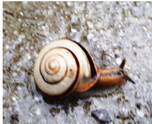
— カタツムリは偏らない —