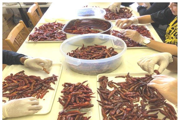
— 作業風景 唐辛子の選別 —