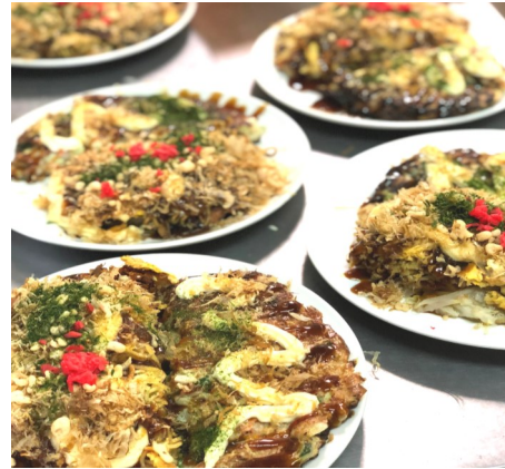
ひと皿に大阪風と広島風が

大阪風は長芋のすりおろしを入れた生地であわふわに仕上がっており、とっても美味しいです。広島風はたっぷりのキャベツとカリカリの焼きそばが最高に美味しいです。