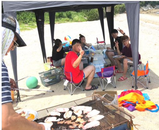
よく食べよく遊ぶ