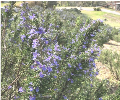
— 青紫色の花を咲かせた ローズマリー —

5 〃 9 東京より縄文村での社員研 修生一名入山 6 圓通寺「定例坐禅会」 17 香川県下での「引きこもり」講 演会 19 〃 20 北海道曹洞宗第二宗務所 講演「彷徨える若者たち」 21 北海道曹洞宗第二宗務所講演 「游於娑婆世界」 27 圓通寺「定例坐禅会」