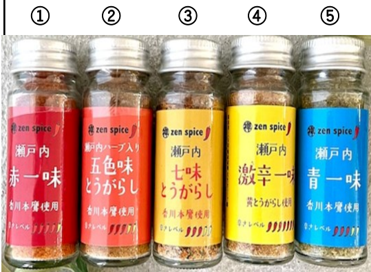
①②③④⑤ 各540円(税込) 内容量 ②13g ①③④⑤15g

上品な香りと辛さが魅力の赤唐辛子 辛レベル★★★★★ ② 五色味とうがらし 香りの豊かさほどこにも負けません ↑ハーブ入り唐辛子 ③ 七味とうがらし 比べてみてください、風味が違います ⑤ 青一味…赤色に熟成する前の唐辛子