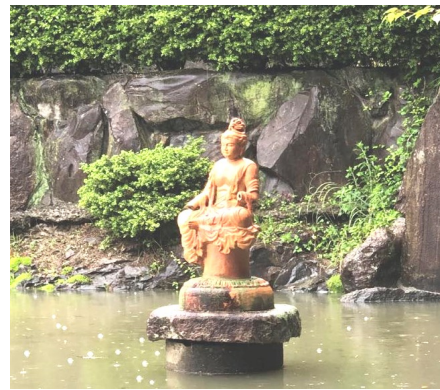
— 喝破池の観世音菩薩像 —

自然界並びに人間界は連動しているかのような不規則で残酷な様相を呈しています。 先月五月中旬の能登地方を震源とする震度5程度の地震に始まり、各地で大小の地震、それに伴う雨の被害を受けられた皆様方に慎みましてお見舞い申し上げます。 そして進攻と称してウクライナに甚大な被害を与えているロシア指導者の神仏を畏れぬ無慈悲な攻撃に悲しみを抱かざるを得ません。 国民の戦死者回避の為に刑務所収監中の犯罪者を軍人として戦争に投入し、その者たちが戦死してもそれは犯罪者だから国民は許し、国民の