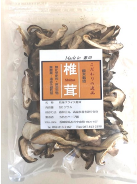
スライス 463円(税込) 内容量50g