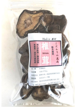
ホール 823円(税込) 内容量100g

自然豊かな環境で原木栽培した肉厚の椎茸を乾燥させました。濃厚な旨味芳醇な香りは格別です。いっぺん食べてみて下さい。