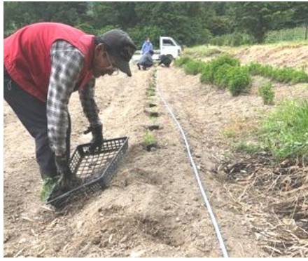
唐辛子を植えつける

今年も香川本鷹唐辛子の栽培を行っています。三月に育苗ポットに種を蒔き、順調に生育し立派な苗に育ちました。後は植え付けるだけでしたが、畑の準備が間に合っていないせいで、畑を耕す事ができず、遅れ遅れになっていました。台風2号の接近に伴い梅雨入りするかもと言われていたのに、二十六日に急いで畑を耕し、畝を作りました。そして二十九日に小雨が降る中、香川本鷹の苗を約千株植えつけることができました。