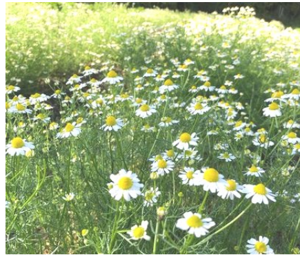
満開のカモミール

三月に植えたカモミールが可愛い花をつけ、収穫の時期になりました。カモミールは一輪一輪手で収穫します。収穫している手には花粉が付いて甘い香りがします。カモミール畑の周辺にはミツバチが忙しそうに蜜を吸っています。心地よい風にカモミールの甘い香りを嗅ぎながら一生懸命蜜を吸うミツバチを観察できるのもこの時期だけの特典で、とても癒されます。